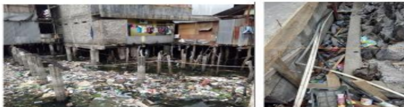
Gambar 6. Kondisi Persampahan Kelurahan Makassar Timur

Permukiman kumuh Kelurahan Kampung Makassar juga tengah dihadapkan dengan permasalahan sampah. Hal ini dikarenakan belum tersedianya sistem pengelolaan sampah yang baik yang sesuai dengan pendekatan 3R ( reduce, reuse dan recycle ), ditambah lagi dengan kesadaran masyarakat yang masih minim akan pentingnya membuang sampah pada tempatnya. Untuk lebih jelasnya kondisi persampahan di permukiman kumuh Kelurahan Makassar Timur dapat dilihat pada gambar berikut