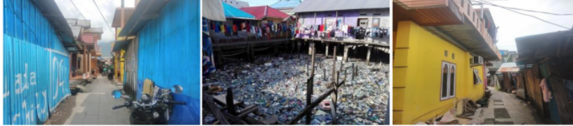
Gambar 1. Kondisi Bangunan Pemukiman Kumuh Kelurahan Makassar Timur