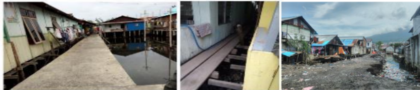
Gambar 2. Kondisi Jalan Pemukiman Kumuh Kelurahan Makassar Timur

jelasan, perhatikan gambar kondisi jalan di Pemukiman Kumuh Kelurahan Makassar Timur berikut